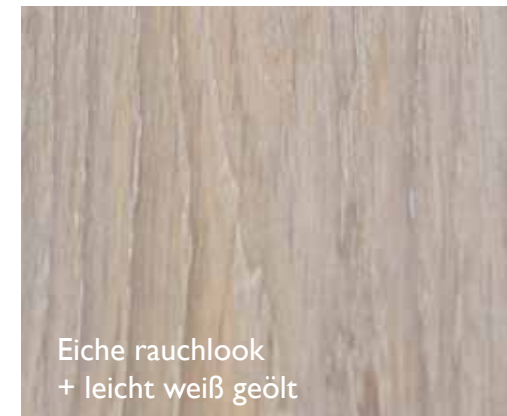
Eiche rauchlook + leicht weiß geölt