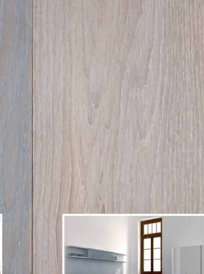
Loft-Art 160 mm Eiche Auslese. Oberfläche rauch- look, leicht weiß geölt und Wachsfinish