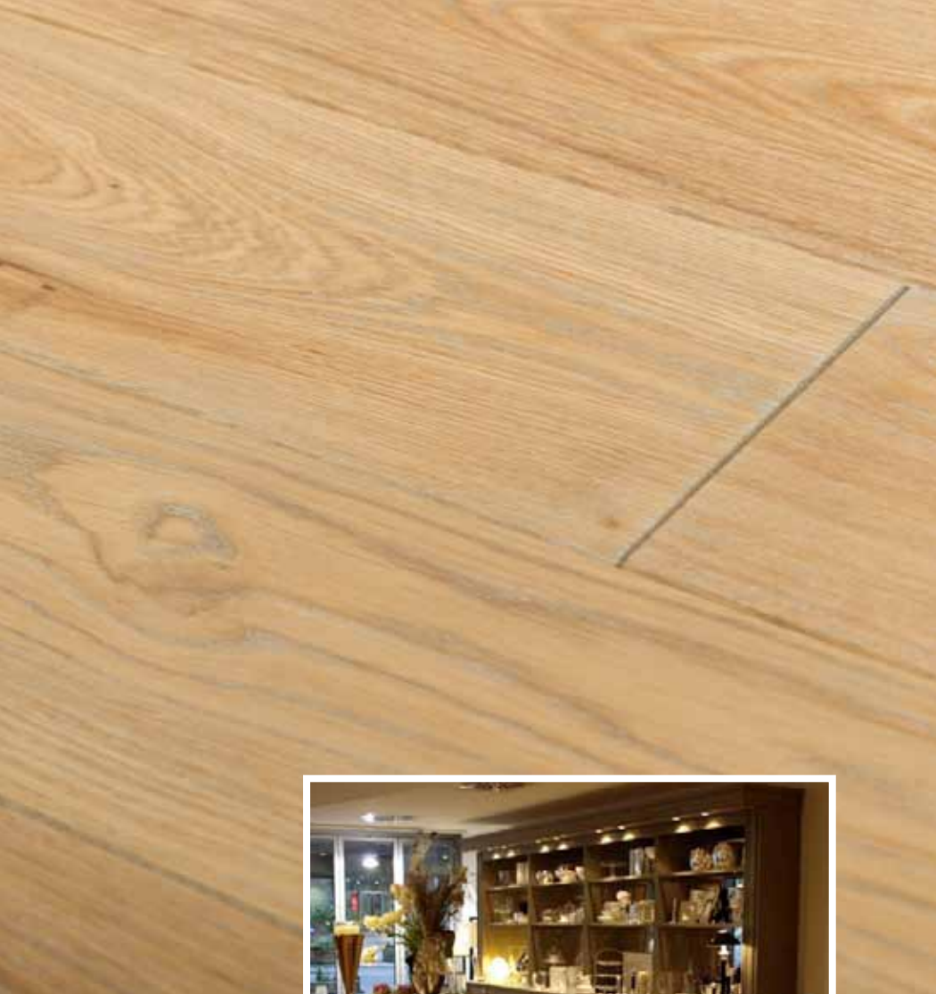
Loft-Art L 140 mm Eiche Balance gebürstet mit silber Pore. Oberfläche transparent geölt und Wachsfinish