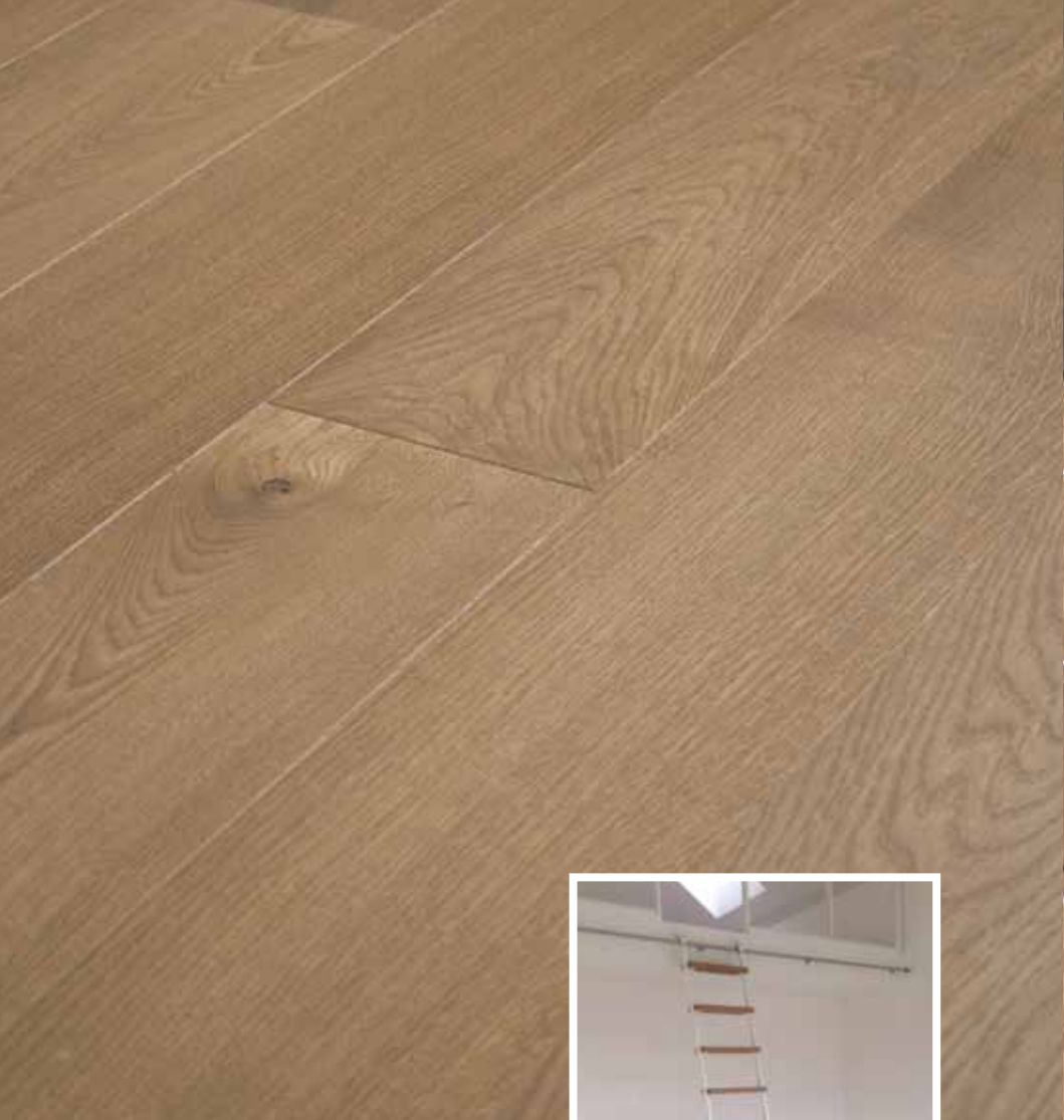
Loft-Art L 140 mm Eiche Auslese, Oberfläche nach Kundenwunsch braun geölt und Wachsfinish. Ebenso sind die Stufen der Schiebeleiter behandelt.