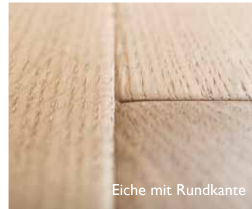
Eiche mit Rundkante