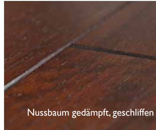
Nussbaum gedämpft, geschliffen

Die Obsthölzer und auch Nussbaum werden nach dem Aufsägen des Stammes gedämpft, um etwas Spannung aus dem Holz zu nehmen. Die Farben werden dabei satter und dunkler. Da die Färbung durch starke Lichteinwirkung nachlässt, wird die Oberfläche von uns immer leicht pigmentiert.