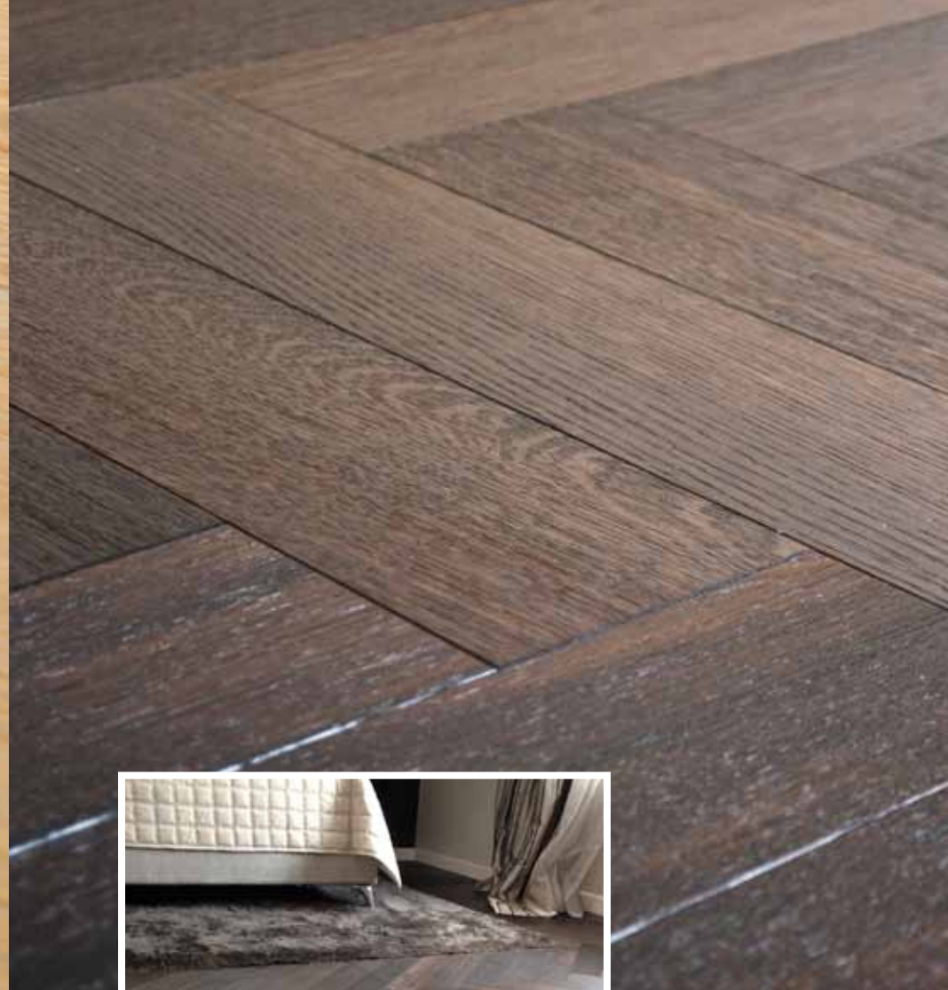
Design-Art 100 mm Eiche Auslese gebürstet im Fisch- grät. Oberfläche transparent geölt und Wachsfinish