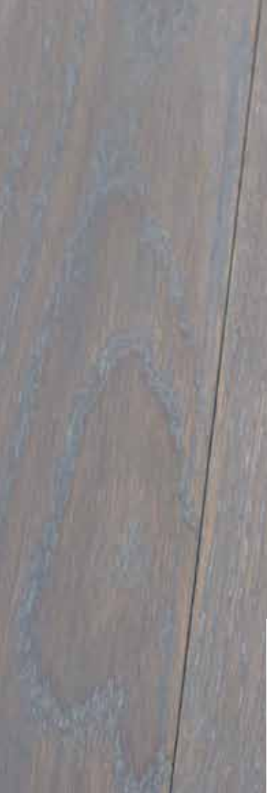
Loft-Art L 140 mm Eiche Auslese. Oberfläche dunkelgrau geölt und Wachsfinish