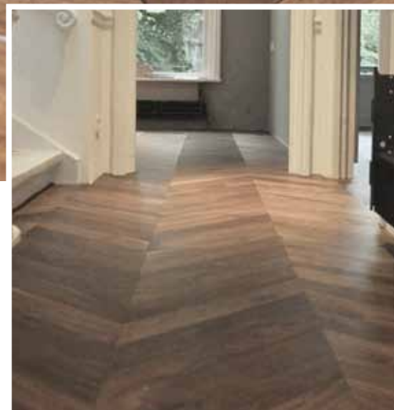
Design-Art 90 mm Nussbaum Auslese französische Gehrung. Oberfläche transpa- rent geölt und Wachs- finish