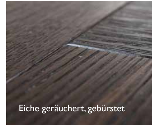
Eiche geräuchert, gebürstet