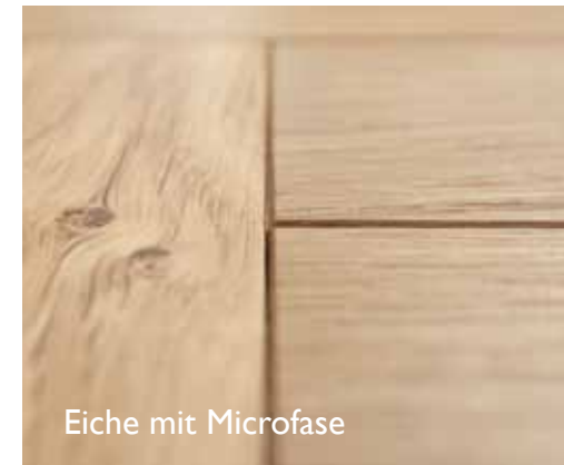
Eiche mit Microfase